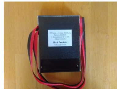
Silbermedaille für Rolf vom TT-Kreis Limburg-Weilburg, Saison 2024/2025