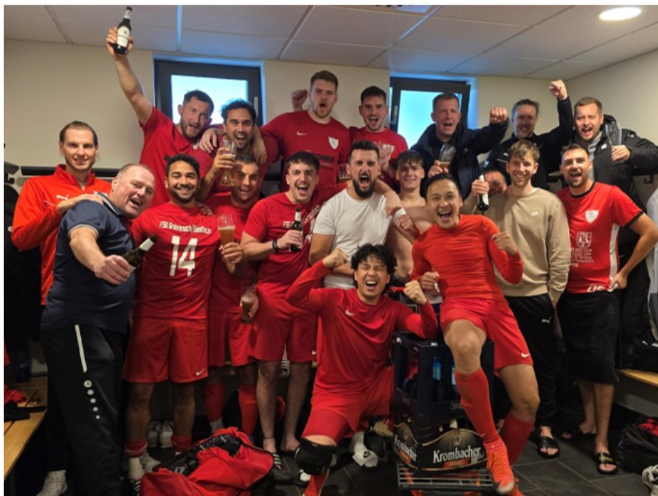
Arbeiten, leiden, feiern – dieser Sieg schmeckt.

Unterm Strich bleibt: Nach dem Trainerwechsel hat sich die FSG I stabilisiert , Spiele oft reifer zu Ende gespielt und sich wieder fest im oberen Drittel etabliert. Die Niederlage in Dauborn ist ein Rückschlag, ändert aber nichts daran, dass die Richtung stimmt.