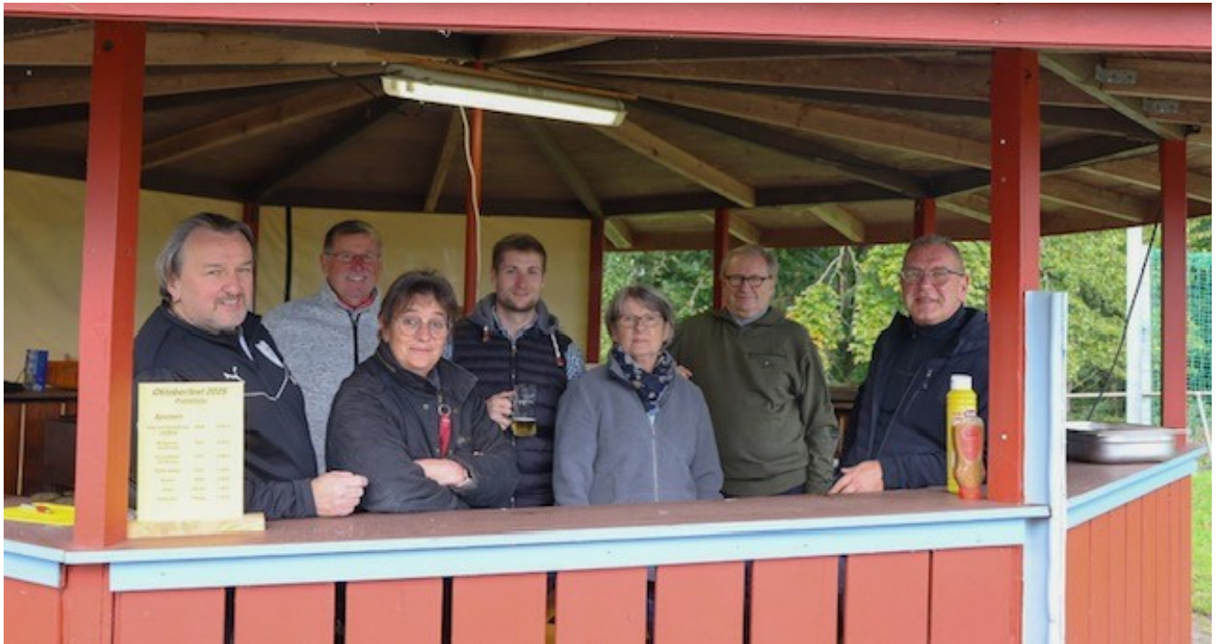
TuS Vorstandsmitglieder und Helfer, die für einen reibungslosen Ablauf sorgten