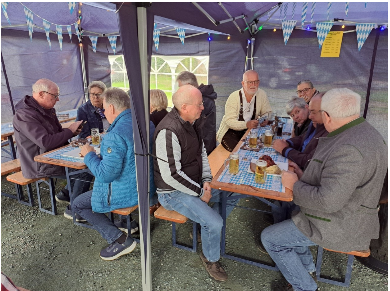
Die Gäste ließen es sich bei Haxen, Kraut, Weißwürsten und Leberkäse schmecken