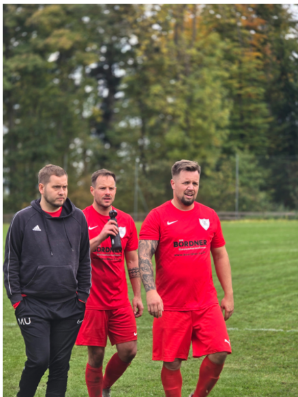
Der Weg in die Kabine – der Puls noch hoch, der Kopf noch im Spiel.

Die Zweite musste in der Reserveliga durch eine echte Lehrzeit. Hohe Niederlagen in Limburg (1:5) , Niedertiefenbach/Dehn (0:8) , Wolfenhausen (1:6) und bei Weinbachtal II (0:5) zeigten klar, wo die Probleme liegen: viel Durchlauf im Kader, kaum eingespielte Abläufe und Defensivarbeit, die noch wachsen muss.